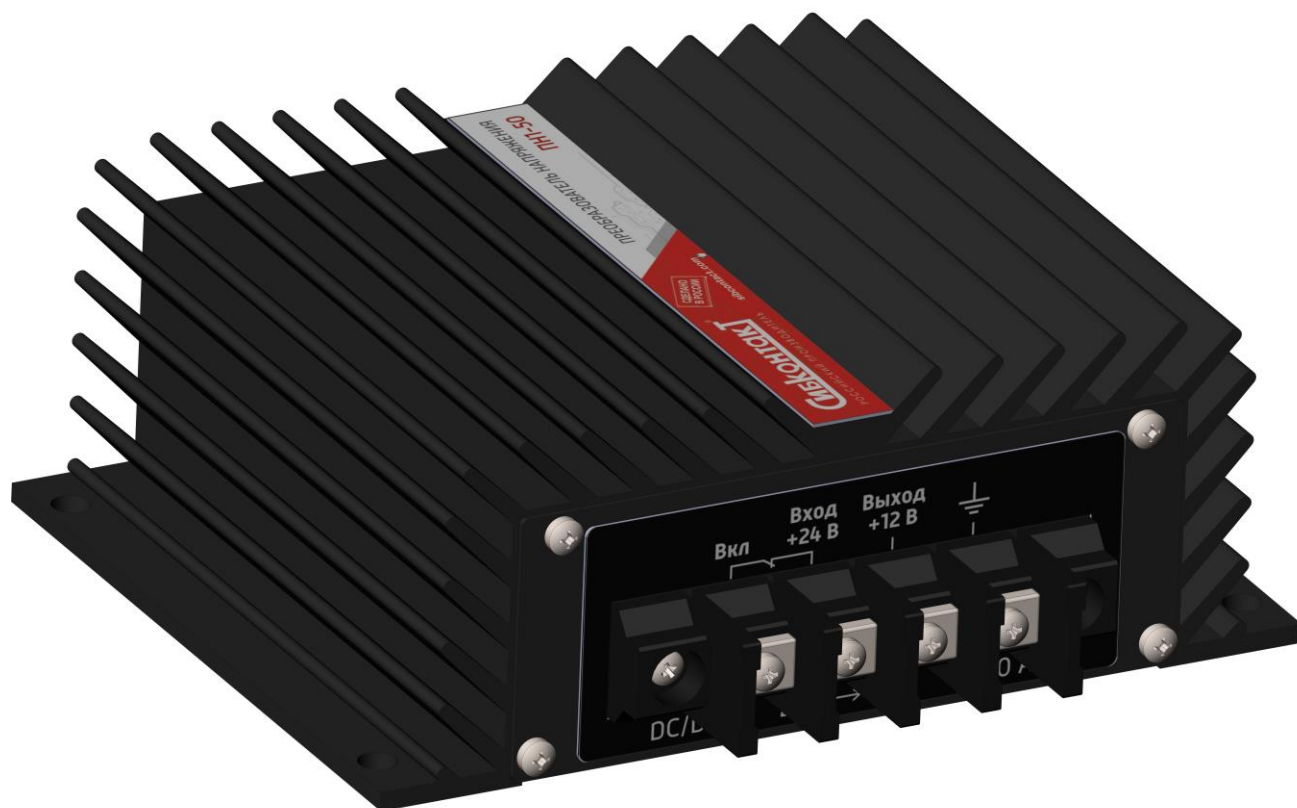
Рисунок 1. Общий вид ПН1-50Г

5.2 Корпус состоит из 3-х частей: Основание, крышка передняя, крышка задняя. На рисунках 1,2 указан общий вид ПН1-50Г